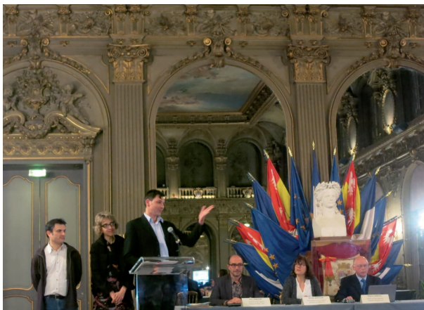
Les organisateurs nancéiens aux côtés du jury lors de la proclamation des résultats