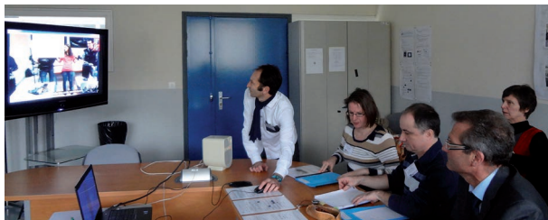
Un jury en visioconférence

de la presse a conduit à des articles dans les quotidiens régionaux ou à des séquences dans les actualités des télévisions locales. Rappelons que tous les articles ou vidéos qui nous sont transmis se retrouvent sur le site. La liste des partenaires des divers concours interacadémiques est également en ligne.