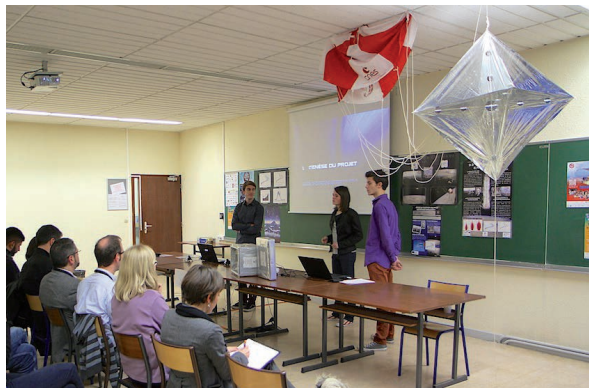
L'équipe du lycée La Mennais présente son ballon-sonde

Nous revenons, dans l'annexe 3, sur le précédent concours, pour en signaler les suites pour l'équipe qui avait été sélectionnée en