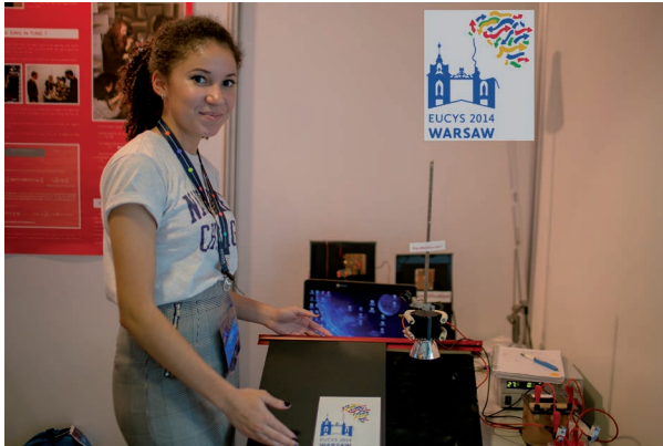
La présentation à Varsovie dans le cadre de EUCYS

A représenté la France au concours européen EUCYS à Varsovie (19-24 septembre 2014)