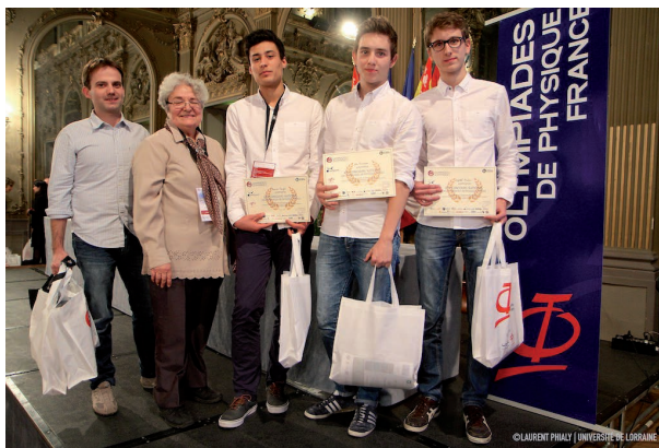
Une équipe avec ses récompenses

De plus, les élèves et professeurs de toutes les équipes reçoivent, dans un sac « Olympiades de Physique France » des livres et revues offerts par les éditions ou partenaires : Belin , Ciel et Espace , CNRS , de Boeck , Dunod , EDP Sciences , Ellipses , Pour la Science , Sciences à l'école , SFP , Vuibert . Enfin, chaque élève ou professeur reçoit du Comité un tee-shirt Olympiades de Physique France ainsi qu'un tee-shirt offert par RS Component .