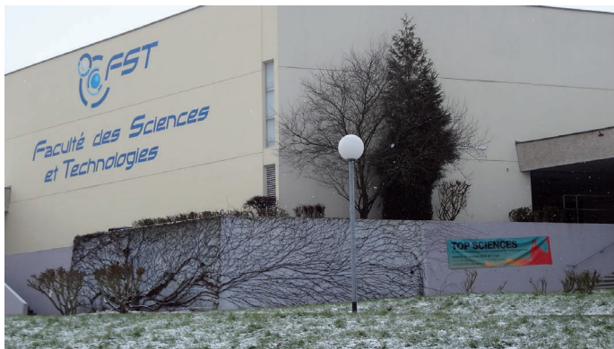
La Faculté des sciences et technologies de l'Université de Lorraine qui a accueilli la XXII e finale