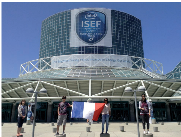
Le groupe au concours ISEF en mai 2014

Premier prix aux Olympiades de Physique France (février 2014)