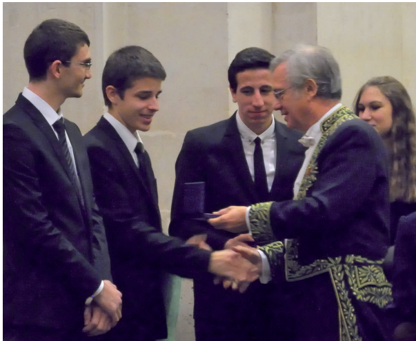
Les lauréats recevant les médailles de l'Académie des sciences

Chaque année, une équipe finaliste des Olympiades de Physique France est récompensée par une médaille de l'Académie des sciences . En 2014, celle-ci était remise lors d'une séance solennelle de l'Académie, le 25 novembre 2014 sous la Coupole, à l'équipe du lycée Albert Schweitzer à Mulhouse qui présentait le projet : L'intouchable thérémine, une mine de sciences déjà récompensée par un premier prix lors de la finale.