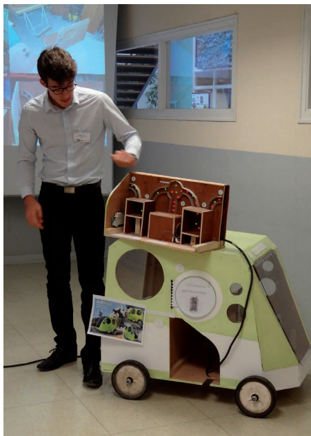
Étude d'une voiture propulsée à l'air comprimé par l'équipe du lycée Sainte-Agnès d'Angers

Soixante-dix-neuf équipes se sont retrouvées en compétition le mercredi 3 décembre 2014 pour les sélections interacadémiques de la XXII e édition. Les concours interacadémiques étaient organisés dans sept centres, par les sections académiques de l'UdPPC, associées aux sections locales de la SFP (Société française de physique), à Angers (académie de Nantes), Bordeaux, Caen, Hazebrouck (académie de Lille), Marne-la-Vallée (académie de Créteil), Reims et Grenoble. Les équipes des établissements français de l'étranger qui faisaient partie de la compétition, ainsi que quelques équipes trop éloignées des centres ont participé à la sélection régionale grâce à des visioconférences mises en place dans les centres d'Angers, Bordeaux, Caen, Marne-la-Vallée et Reims.