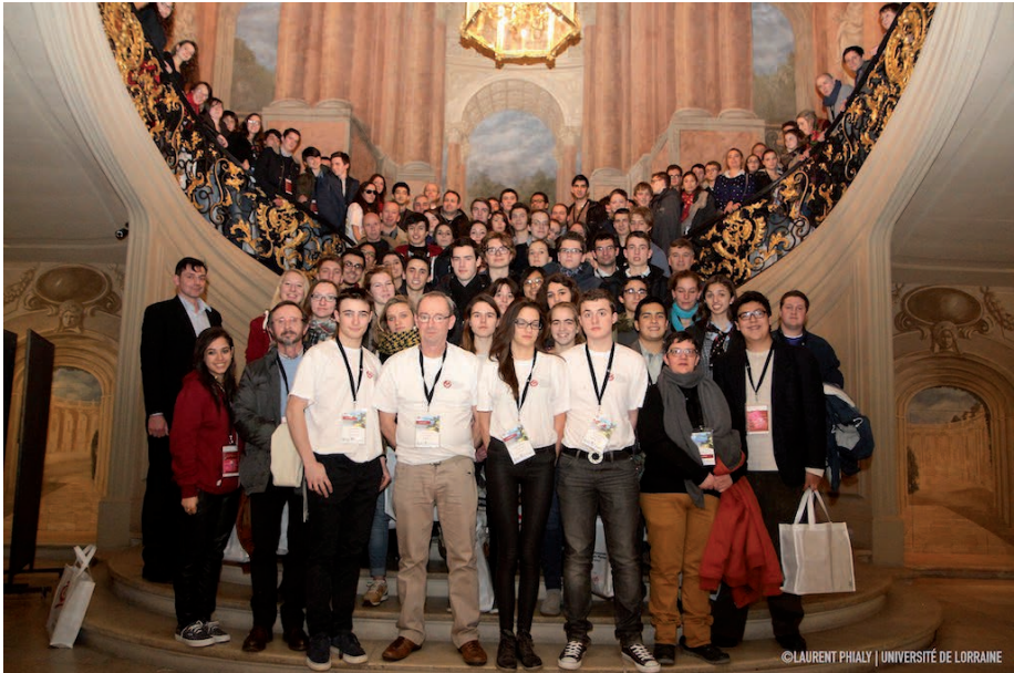
Photo souvenir du groupe dans l'escalier monumental de la mairie de Nancy

La participation au concours International Science and Engineering Fair (ISEF), organisé par la Society for Science and the Public (SSP) et parrainé par Intel, constitue une récompense unique en son genre. Elle est attribuée à un groupe auquel le jury décerne un Premier prix et qui remplit un certain nombre de critères spécifiques au concours ISEF. C'est ainsi que son effectif, dès l'inscription aux Olympiades, doit être limité à deux ou à trois élèves. Le jury a sélectionné l'équipe du lycée La Mennais de Guérande pour son projet intitulé « 32 kilomètres en ballon ». Il s'agira de la cinquième participation de la France à ce concours et les Olympiades y enverront pour la cinquième fois une équipe.